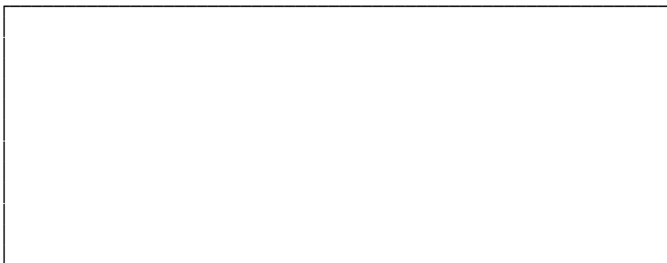
Схема расположения объекта капитального строительства на земельном участке в цветном исполнении (с привязкой к конкретным точкам)

в соответствии со схемой расположения объекта капитального строительства на земельном участке, с привязкой к конкретным точкам и в соответствии с исполнительной съемкой земельного участка заявителя (заявителей) с изображением земельных участков, смежных к земельному участку заявителя (заявителей, выполненной в масштабе 1:500 в срок, не превышающий 3 месяцев на момент обращения заявителя (заявителей) в администрацию.